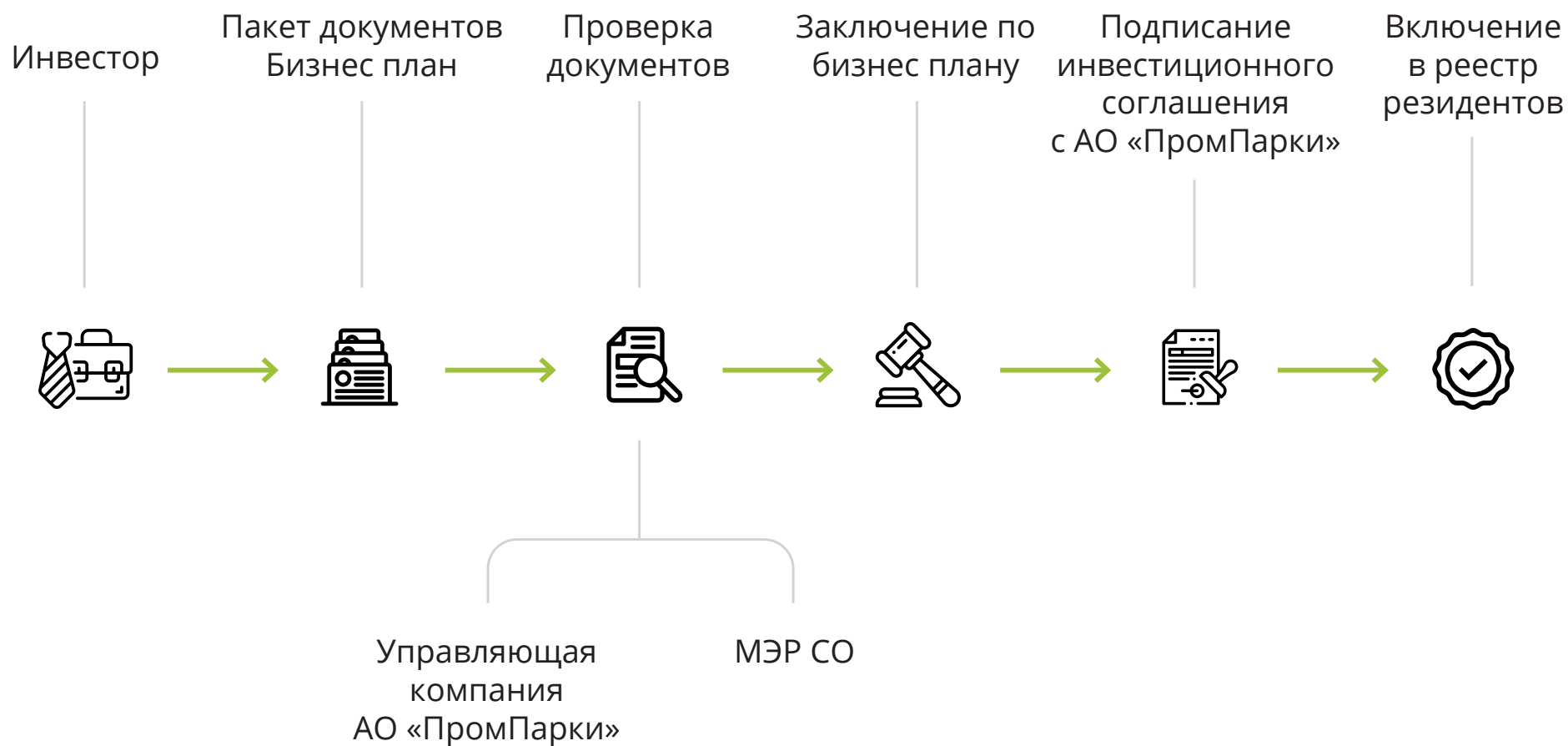
СХЕМА ПОЛУЧЕНИЯ СТАТУСА РЕЗИДЕНТА